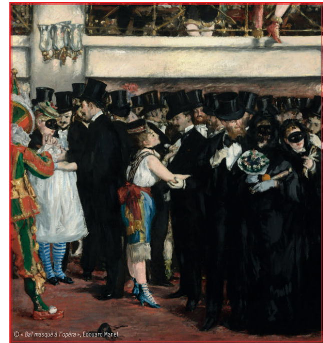
© « Bal masqué à l'opéra », Edouard Manet

Conception et impression : mairie de Saint-Laurent-d'Agnay - Ne pas jeter sur la voie publique. Acheté d'imprimer : 1 février 2026.