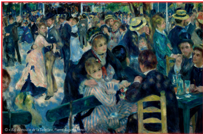
© « Bal du moulin de la Galette », Pierre-Auguste Renoir

Une collection haute en couleurs qui traverse les grandes périodes de l'histoire ; de l'Antiquité à aujourd'hui ; et vous fait découvrir, en un clin d'œil, les grands courants artistiques qui ont façonné notre monde.