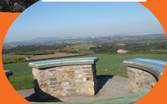
La table d'orientation avec vue à 360°