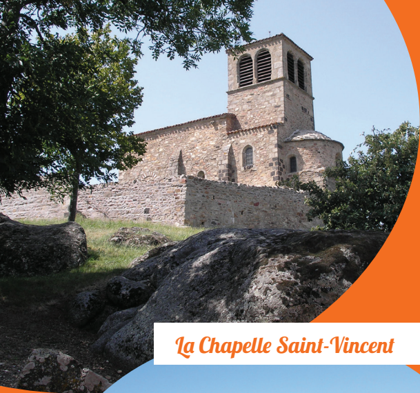
La Chapelle Saint-Vincent